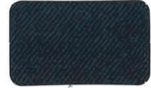
3006 ROYAL BLUE