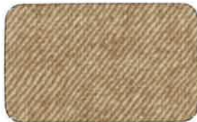
606 SANDY BROWN