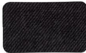
305 SLATE BLUE