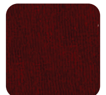
14 THEATRE RED